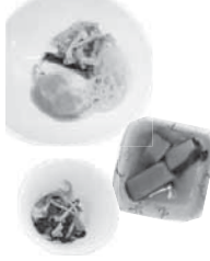
試食会で調理していただいたメニュー

ソフィアの1〜2月のH&Bランチ(ドリンク)は、新メンバーの二年生が考案している。例えば、二月上旬の「旬の野菜で免疫力UPランチ」は、素揚げしたタラのみぞれがメインの、旬の食材にこだわった献立。メニューの完成には、約二カ月ほどかかる。何度も試作・試食を繰り返して、完成させていく。もちろん栄養価の計算も行う。最後に、実際に調理を担当するソフィア