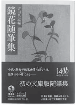
『鏡花随筆集』 岩波書店 吉田昌志編

鏡花の世界において、不思議な呼名の「シシデ」が詠まれていた。薄紫の花が二つ、「手にせば消えなむばかり」に咲いたあと、翌日、翌々日と次々に小さな花をたくさんつけた。