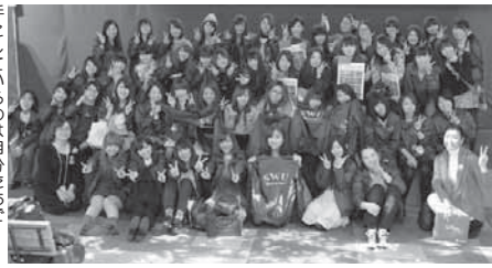
手にしているのは自分たちでデザインしたスタックジャンパー

勇気の翼ファッションショーにボランティアとして参加した。このファッションショーでは、障がいのある方々がモデルとなる。衣装は、プロのデザイナーとファッション専門学校の学生の作品で構成される。参加学生の多くは、外部のファッションショーに関わることも、障がいのある方と深く関わることにも今回が初めてだった。