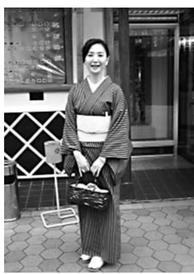
浅草演芸ホール前で

たすら稽古をし、その長くてつらい修業の中から今の「オリジナリテイ」をようやく作り上げたのでしよう。