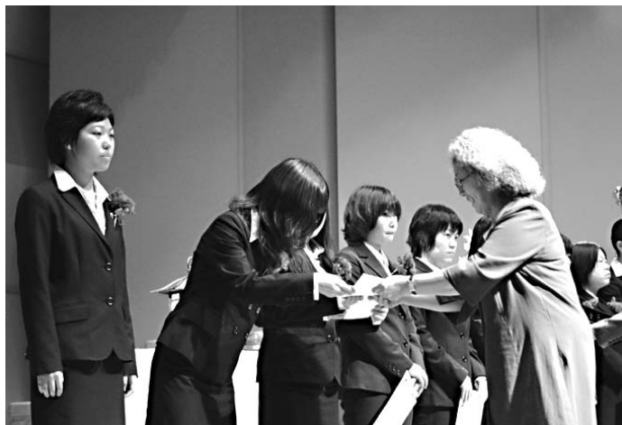
人見理事長より奨学金を授与される学生