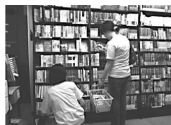
じっくり選んでいます

今回で三度目となる「学生選書ツアー」が五月十四日に神保町の三省堂書店で行われました。参加者は目印になるピンのTシャツを着て店内を一階から六階まで歩き、お薦めする本を捜し