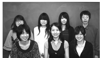
学友会執行部のみなさん