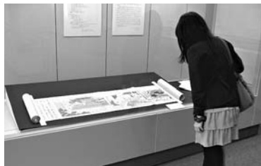
『玉藻前絵巻』の展示

文豪、夏目漱石が世を去る三ヶ月前に、若き芥川龍之介・久米正雄と交わした往復書簡、日本中世のお伽草子『ささやき竹』『玉藻前』などの色彩豊かな絵本や絵巻、中世イギリスの詩人チョーサーの最高傑作、『カン