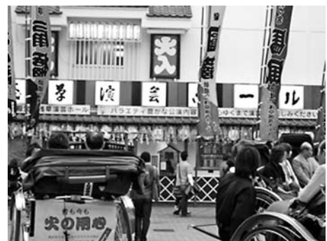
浅草演芸ホール前の賑わい

ことに精力を傾けます。それが次第に「師匠そっくり」と言われることに限界を感じ、何とか自分なりの斬を作ろうと苦しみ始めるのだそうです。これまでに何百人という落語家が演じてきた演目にどうやったら自分なりのオリジナリテイを足すことができるのか、古典落語という枠の中でどうやったら新しさを出せるのか、これは多分私などの想像を絶するぐらいに大変なことなのだろうと思います。